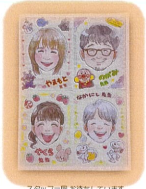
スタッフ一同お待ちしております。