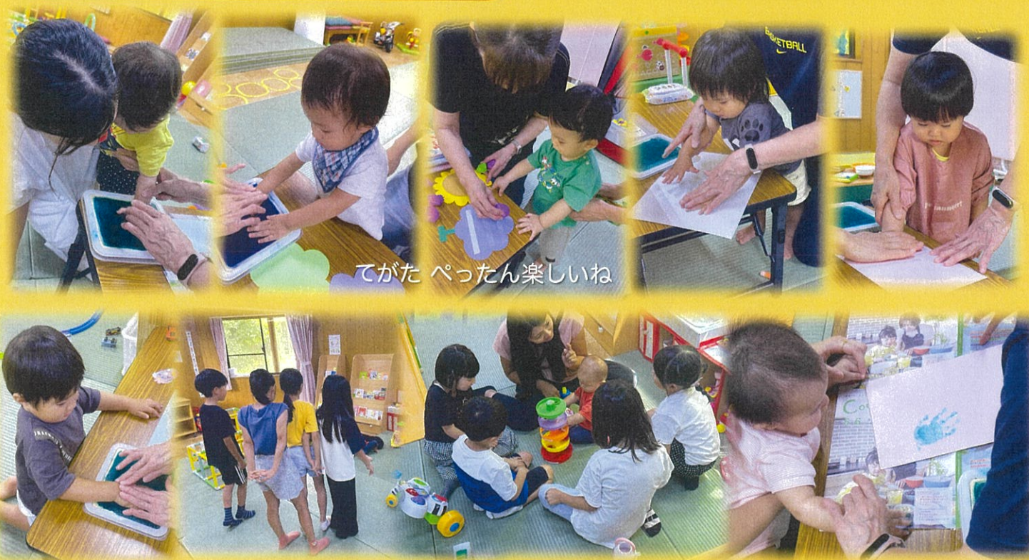
てがた ぺったん楽しいね

10月23日(水曜日)午前10時~午後1時 職員会議のため 休館 午後1時より 開館 します。