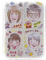
スタッフ一同お待ちしております。