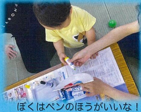
ぼくはペンのほうがいいな!