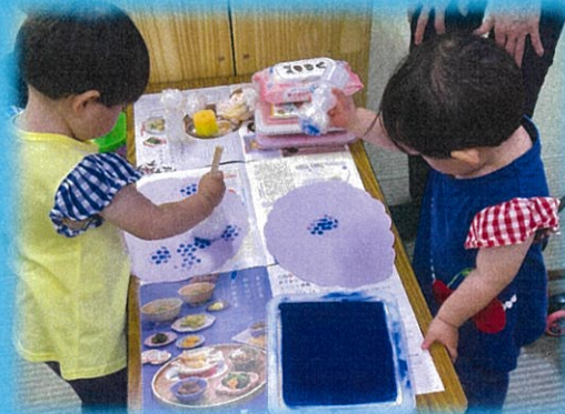
おれ!きれいにできたんちゃう!