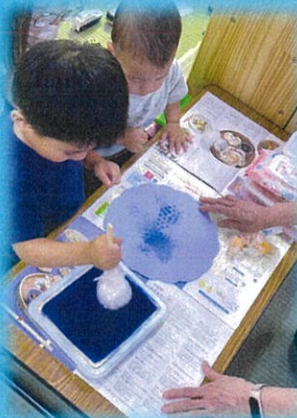
トントン~お兄ちゃん やっぱりうまいな~