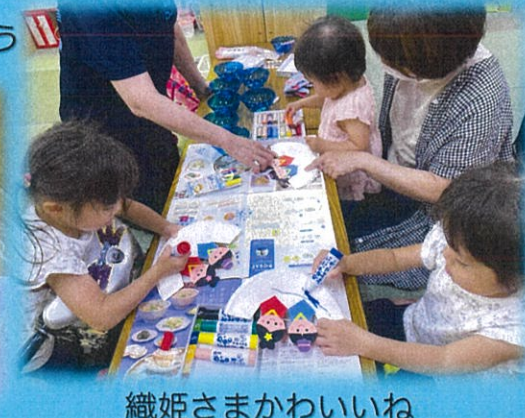
織姫さまかわいいね

救命救急のお勉強! 先日、ありんこ、保育園、学童の先生と一緒に京都市消防局の救命救急の講習会に参加してきました。救急車に添乗し本当に救命救急を実践してきた方の経験と説明は、迫力があってドキドキしました。乳児の心臓マッサージ、呼吸確認の仕方、AEDの使い方、誤飲してしまわない玩具の大きさ、誤嚥してしまった時の対処法など、多岐にわたる内容でしたが絶対身につけておかないといけないスキルでした。ありんこ広場にいられているお母さんやお父さんにも伝えて行けたらいいな と思う今日この頃です。