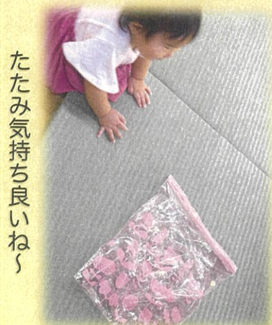
たたみ気持ち良いね〜