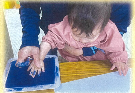
手がた👏おもしろ〜い