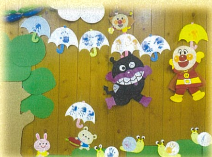
傘がいっぱいになったね