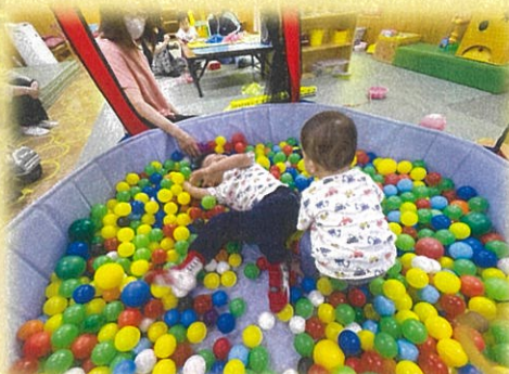
ボールプールたのし〜♪