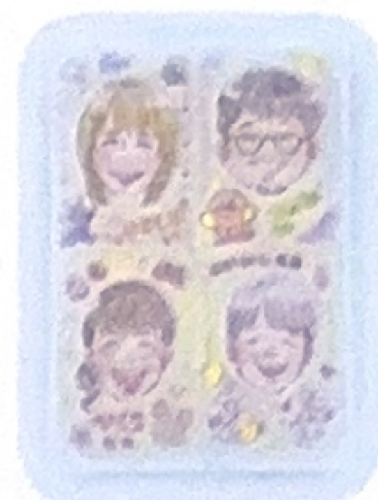
スタッフ一同お待ちしております。