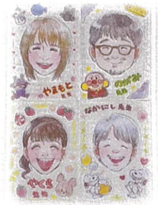
スタッフ一同 お待ちしています。